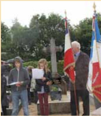
Le devoir de mémoire du conseil municipal des enfants treilliérains.

Il y a un an, la ville de Treillières publiait le premier journal du centenaire 1914-1915 qui rendait hommage aux 31 soldats de Treillières morts pour la France en 1914.