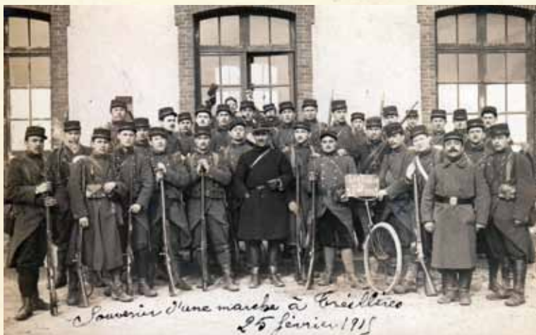
Soldats du 65 RI de Nantes de passage à la gare de Treillières lors de manœuvres, le 25 février 1915.

Régiment de zouaves à Tunis. Passé au 1 er R. de tirailleurs algériens. Caporal. Fait prisonnier le 22 avril 1915 alors qu'il venait d'être « blessé d'une balle à la face qui l'avait défiguré. Arrivé au lazaret d'Ohrdruf in Thuringen (Allemagne), le 1 er mai, on lui a prodigué les meilleurs soins. Sa blessure était en bonne voie de guérison, mais le pus absorbé avait infecté les bronches et les poumons et déterminé la pneumonie qui l'a enlevé le 16 mai 1915. Il a été enterré avec les honneurs militaires. Il est mort chrétiennement ayant reçu ses derniers sacrements quelques jours auparavant ». (Comité international de la Croix Rouge pour les prisonniers de guerre). Inhumé au cimetière du camp de prisonniers d'Ohrdruf puis transféré à la nécropole nationale des prisonniers de guerre 1914-1918 à Sarrebourg (Moselle).