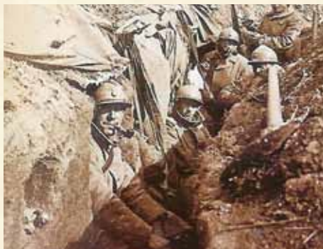
Le casque Adrian, qui remplace le képi, est utilisé pour la première fois en septembre 1915 lors de la bataille de Champagne