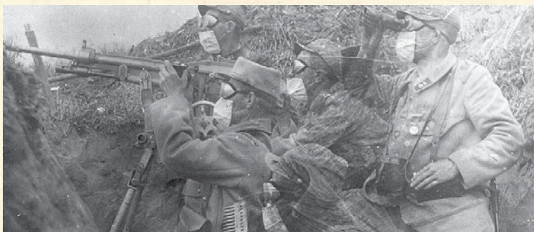
Pour la première fois, le 22 avril 1915 à Ypres, les Allemands utilisent des gaz asphyxiants. Pour s'en prémunir, les soldats du 81 RIT de Nantes, ici en Artois, sont aussitôt équipés de lunettes et de masques sommaires faits de mousseline et de coton hydrophile.